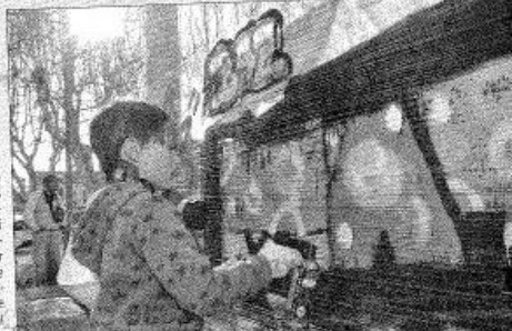
Le cellulogriff, ou l'art de peindre à la bombe à peinture sur du cellophane tendu sur deux arbres, a été la découverte de l'année!