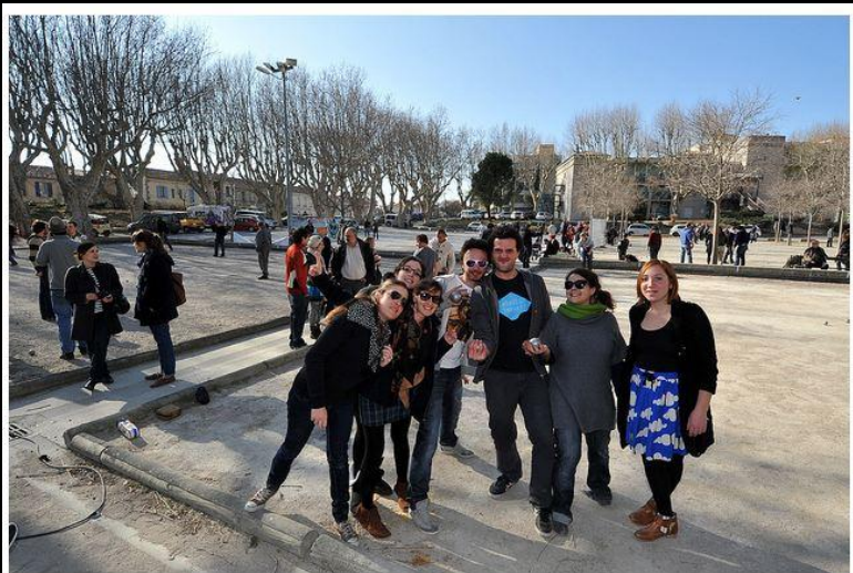
Les organisateurs de Tu tires ou tu scratches

La nouvelle boule printanière, teckyo.com, Radio 3DFM, Boulisme Magasine, de Film en Aiguille, Culture.com